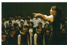
ミニコンサートでの全校合唱