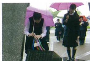
3年生 広島・京都修学旅行

年間を通した多彩な学校行事(宿泊研修、修学旅行、職場体験、学園祭、体育祭、ミニコンサート、百人一首大会)